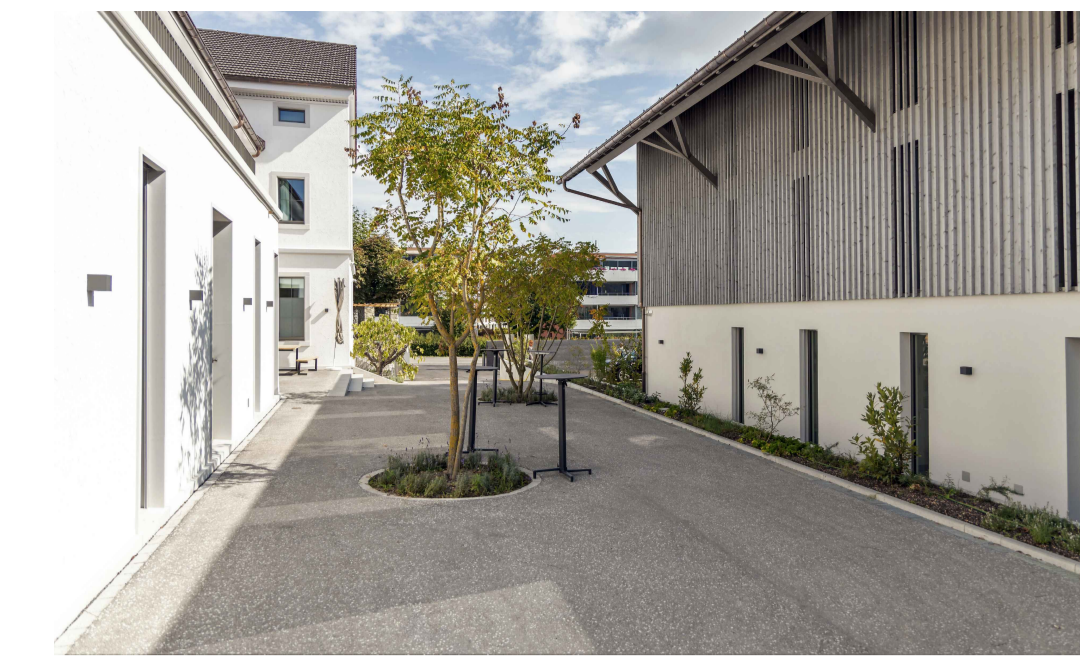
Farbaspfalt mit Edelsplittmischung