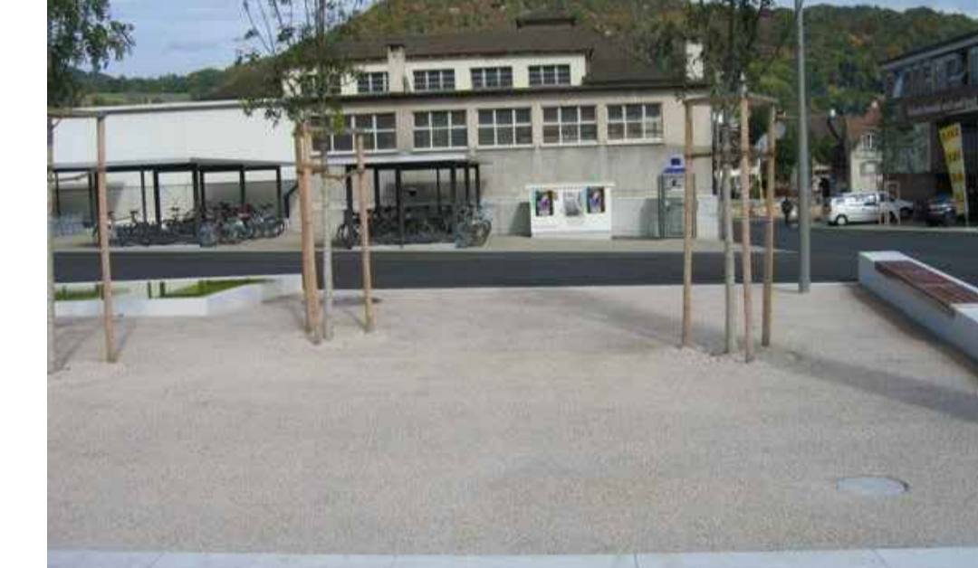
Chaussierter, baumbestandener Platz mit Sitzmauer