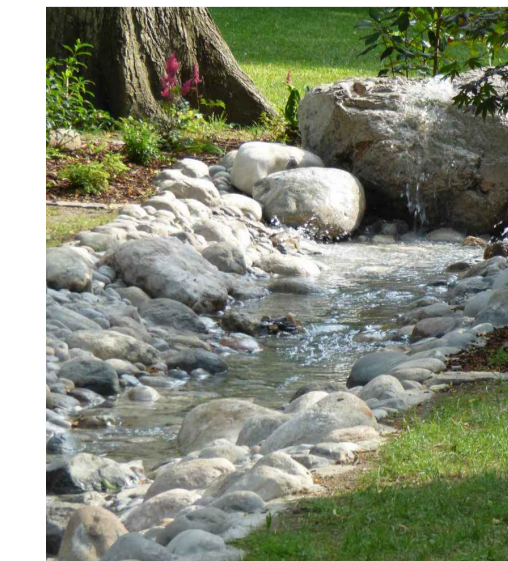
Wasserlauf zum Spielen